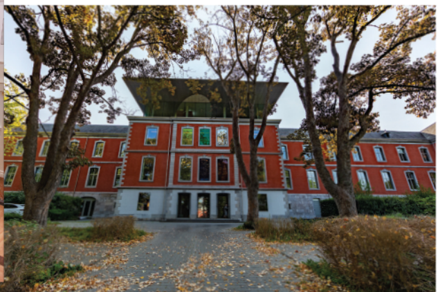
Seraling Chateau Val Saint Lambert Abbaye