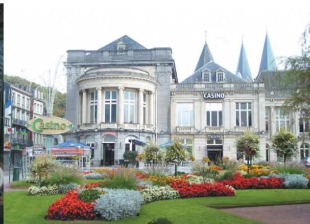
Spa - le Casino