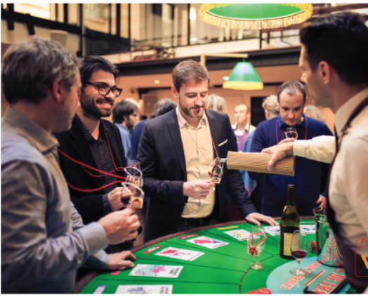
Liege Ready Steady Cinerea VINI VEGAS © Cinérea International