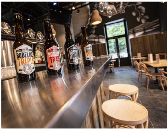
Spa Brasserie Bobeline