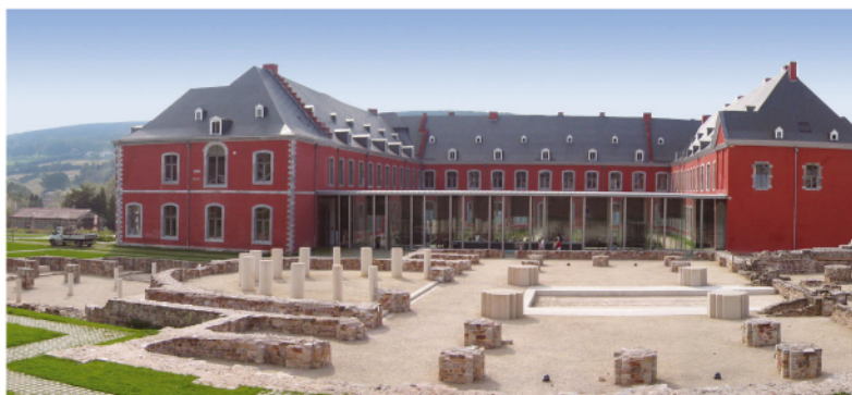
Abbaye de Stavelot © « Abbaye de Stavelot »

Pour tout type d'organisation, avec son magnifique jardin du cloître , ses trois musées de niveau international , ses salles prestigieuses, ses caves séculaires, l'Abbaye de Stavelot est à n'en pas douter la destination plaisir.