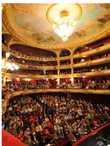
© Jacques Croisier - Opéra Royal de Wallonie Liège