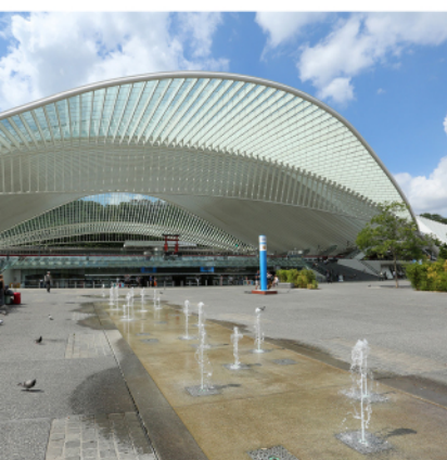
© GareSNCB de Liège-Guillemins-Arch. Ing Santiago CALATRAVA

D'autres lieux s'offrent également à vous : Blegny-Mine , l'Abbaye du Val Dieu, la Ferme Saint-Lambert , FLYIN (le simulateur de chute libre), ou encore, le Fort Aventure de Chaudfontaine.