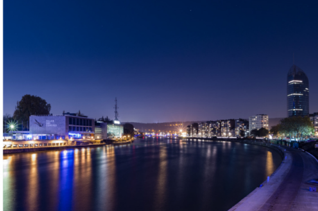
Palais des Congrès