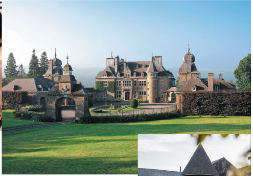
Spa - le Manoir de Lébtiotes