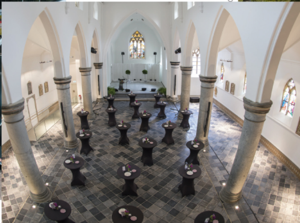
Eupen Kloster Heideberg Z2