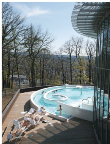
Les Thermes de Spa