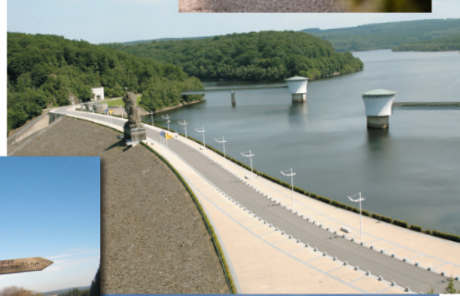
Barrage de la Gileppe

Weventures tout comme Adrenaline Events vous propose la création de teambuilding indoor ou outdoor sur mesure toujours innovant, mêlant l'aventure et la cohésion d'équipe et ce dans toute la province de Liège !