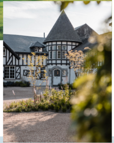
Domaine Bronromme