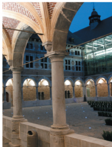
Musée de la vie Wallonne

Résolument animée, la ville accueille régulièrement de grandes expositions et regorge de cafés, brasseries et restaurants de qualité offrant l'embarras du choix !