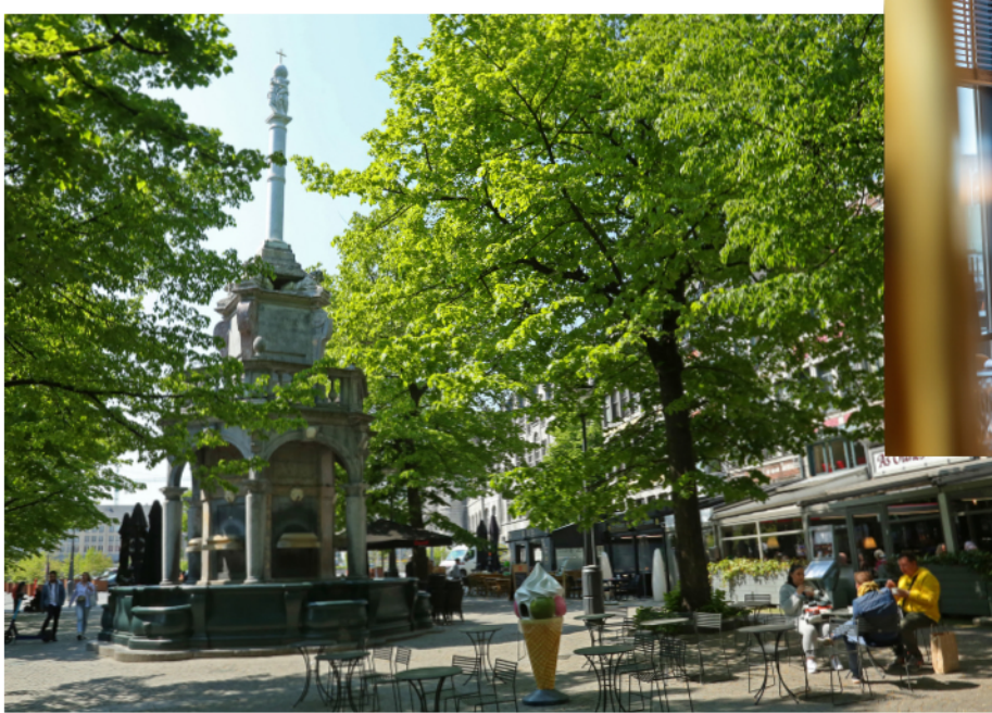
Liège place du Marché - Le Perron