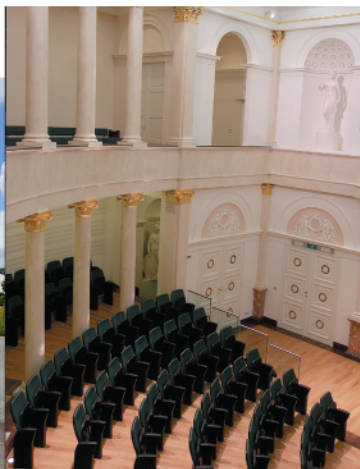
ULG - salle académique