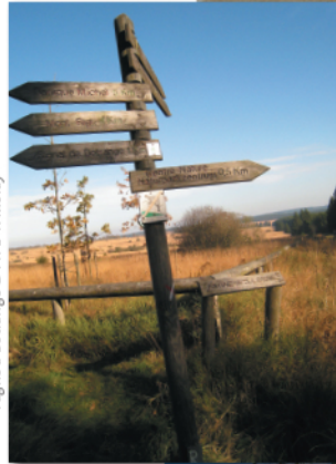
Figine à Botrange