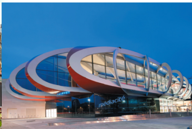
Médiacité © Marc Detiffe