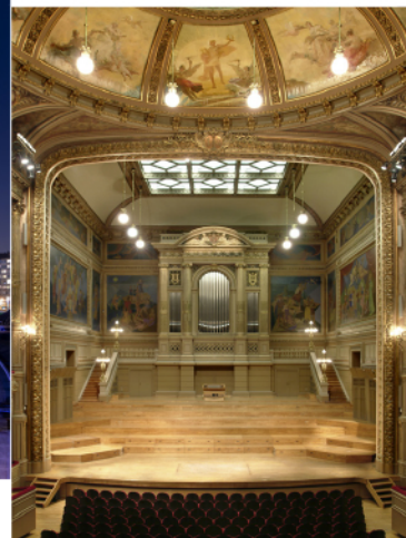
Salle Philharmonique de Liège